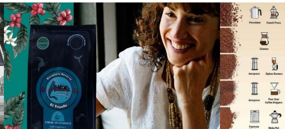
Cesmach, Chiapas, México