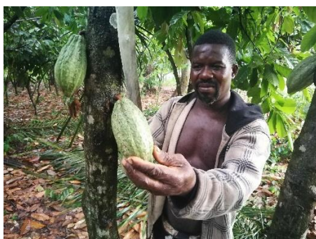
PROCAB, Kpalimé, Togo