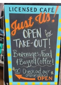
Just Us! Coffee, Nova Scotia, Canadá