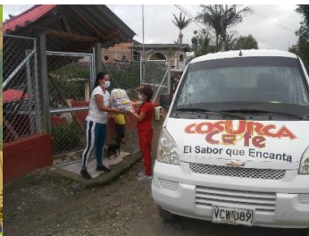
Cosurca, Cauca, Colombia