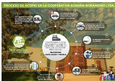
Norandino, Piura, Perú