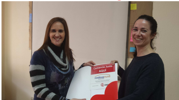
Entrega del diploma y distintivos que renuevan la membresía a la CECJ.

En 2016 se ha continuado con la renovación de la membresía de las organizaciones de la Coordinadora Estatal de Comercio Justo.