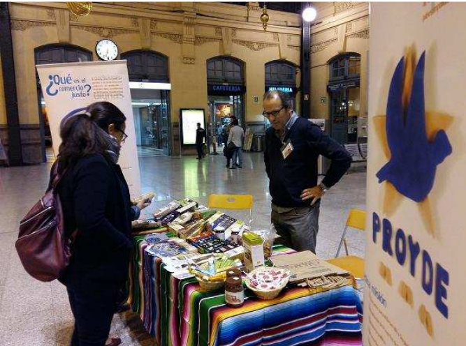
Puesto informativo-comercial en la estación de Valencia Nord

Entre el 7 y el 13 de noviembre, se desarrolló una campaña de difusión del Comercio Justo en colaboración con Adif. Diez estaciones ferroviarias de cinco comunidades autónomas (Andalucía, Principado de Asturias, Castilla y León, Comunidad Valenciana y Galicia acogieron stands informativo-comerciales) acogieron puestos informativo comerciales, instalados por organizaciones miembro de la CEJ.