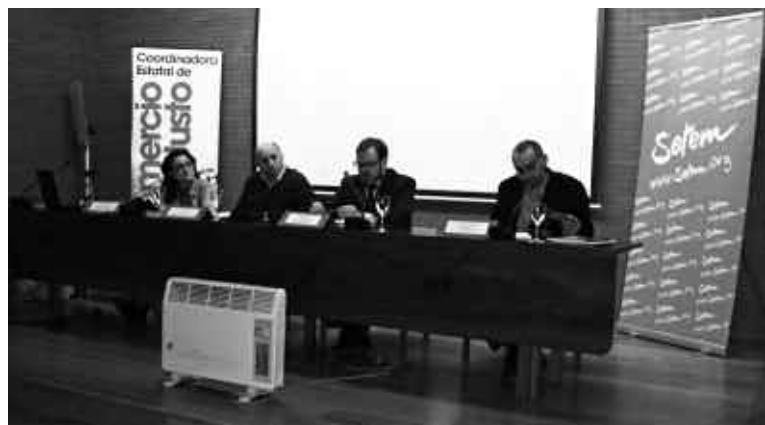
Presentació de l'informe a Madrid.

La publicació, de la qual es van imprimir 1500 exemplars, va ser distribuïda entre les organitzacions membre, universitats, institucions públiques, mitjans de comunicació, altres entitats i ONG interessades.