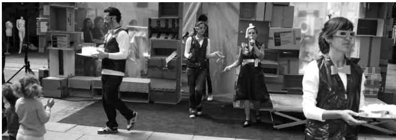
Celebració del Dia Mundial.

En la línia de formació i assessorament, va tenir lloc un taller teòric i pràctic sobre disseny d'aparadors interiors de botigues, impartit per professionals del sector.