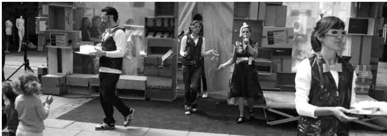
Día Mundial do Comercio Xusto.

Na liña de formación e asesoramento, levouse a cabo un taller teórico e práctico centrado no deseño de escaparates e interiores de tendas que foi impartido por profesionais do eido.