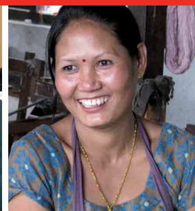
Neremili Jostuna. Nepal